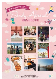
「留学ハンドブック」表紙